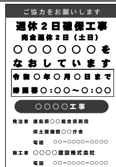
(標示板記載例) 完全週休2日(土日)の場合